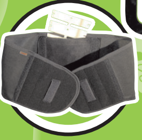
3. Therapiestufe: Lumbalbandage mit Pelotte