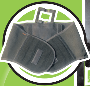
2. Therapiestufe: Lumbalstützorthese